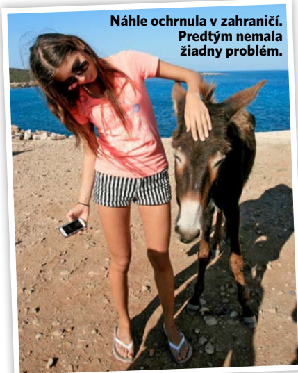
Náhle ochrnula v zahraničí. Predtým nemala žiadny problém.

pochybni o tom, že sa dám do poriadku, a to veľmi veľa urobí. Možno by som na tom bola horšie, ak by som od začiatku vedela, aké to je v skutočnosti.“ Dnes už vie, že nič nebude také ako predtým. „Čo už, život ide ďalej. Chcem žiť naplno, veď život sa nekončí, ak niekto skončí na vozíku, tak prečo nezabojovať, aby